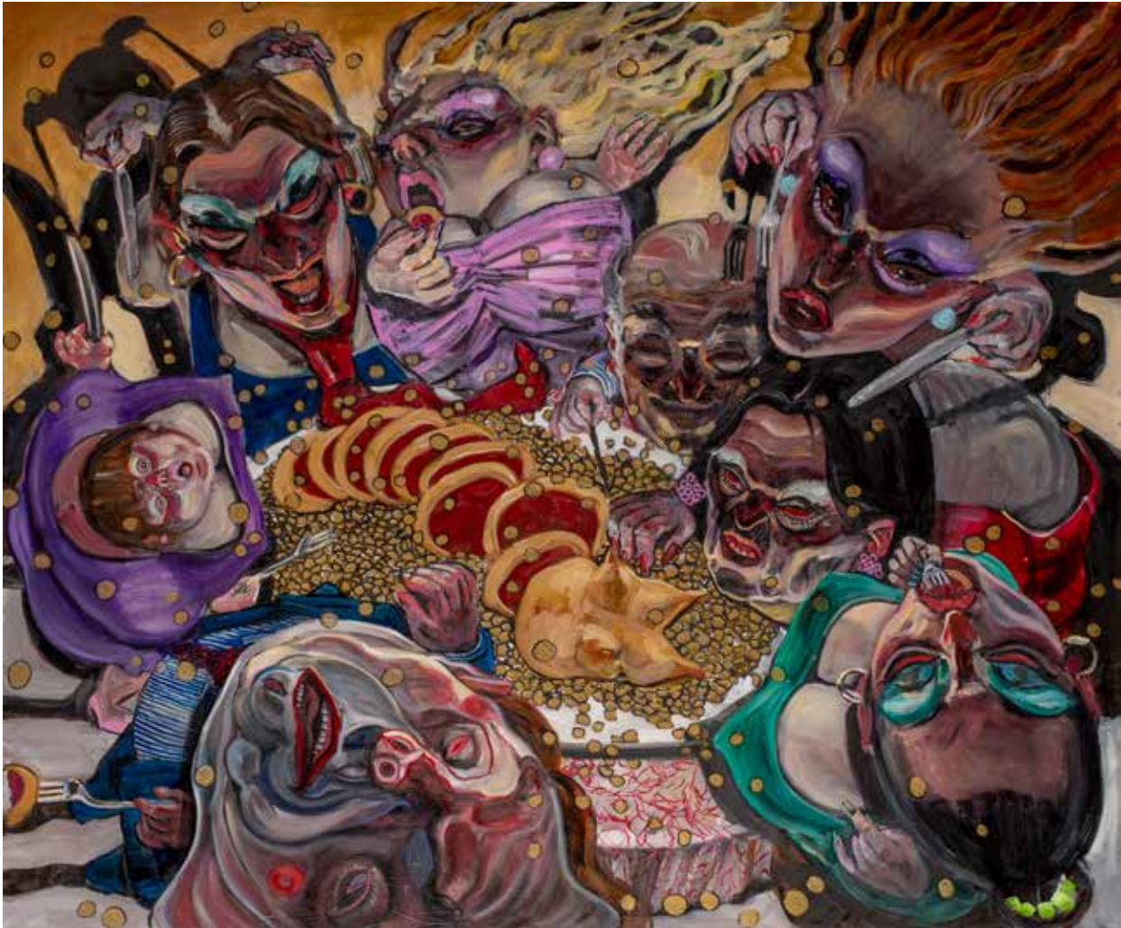
Enrico Robusti - Zamponi e lenticchie Olio su tela, 120x100, 2020 /ENGI/ Oil painting on canvas, 120x100, 2020