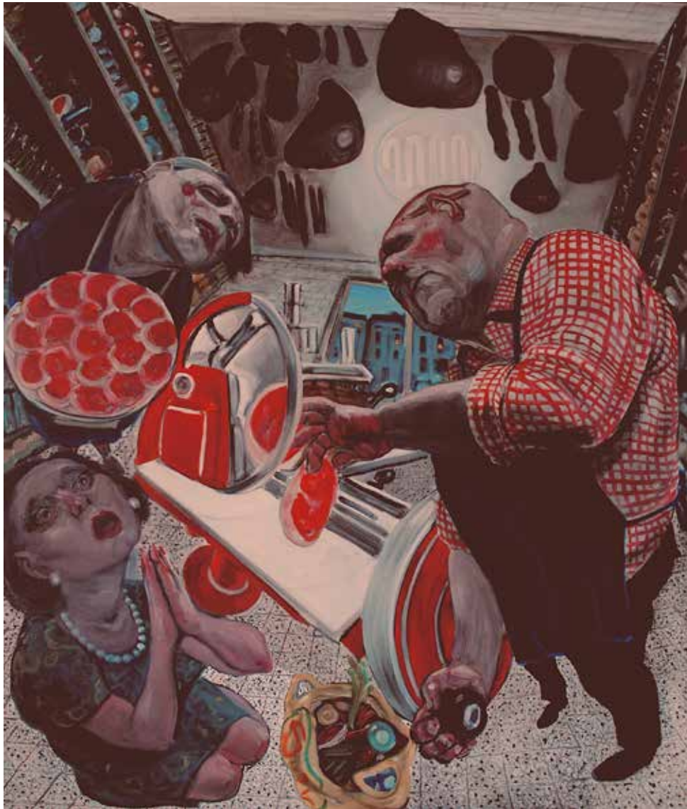
Enrico Robusti - Affettazione liturgica Olio su tela, 120x100, 2015 /ENGI/ Oil painting on canvas, 120x100, 2015