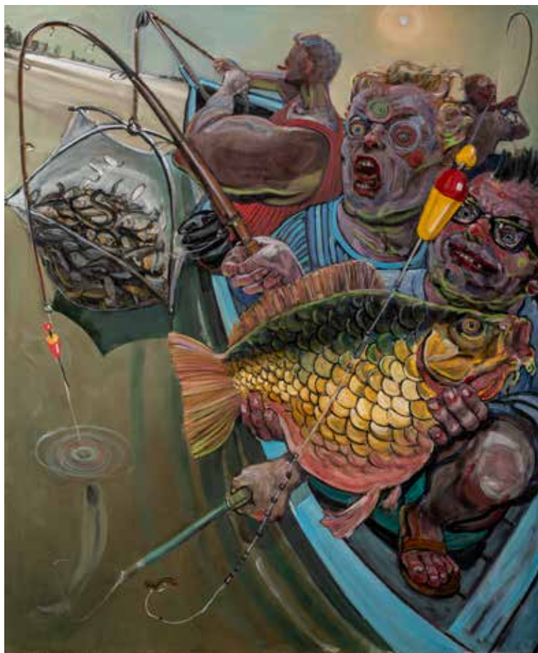
Enrico Robusti Acque dense

IENGI Oil painting on canvas, 100x150, 2021